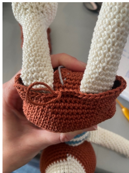
R40b – créer les jambes en passant le crochet des 2 côtés du short.

TUTORIEL OFFERT PAR VALERIE_FIL'UN CROCHET