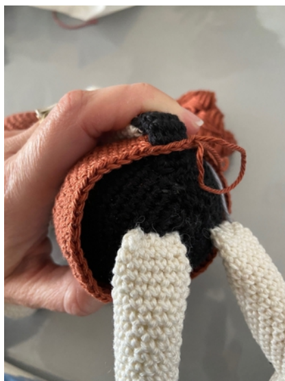
R34b – faire un passage pour la queue du chien.